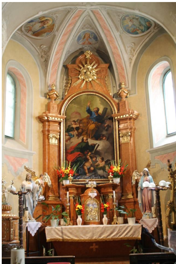
7. Templom főoltár képe