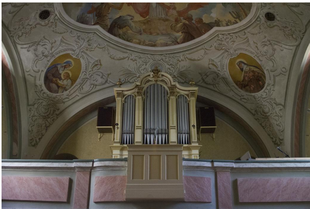
8. A kóruson látható az 1810-es évekből származó 12 váltós orgona (főbejárat belülről)