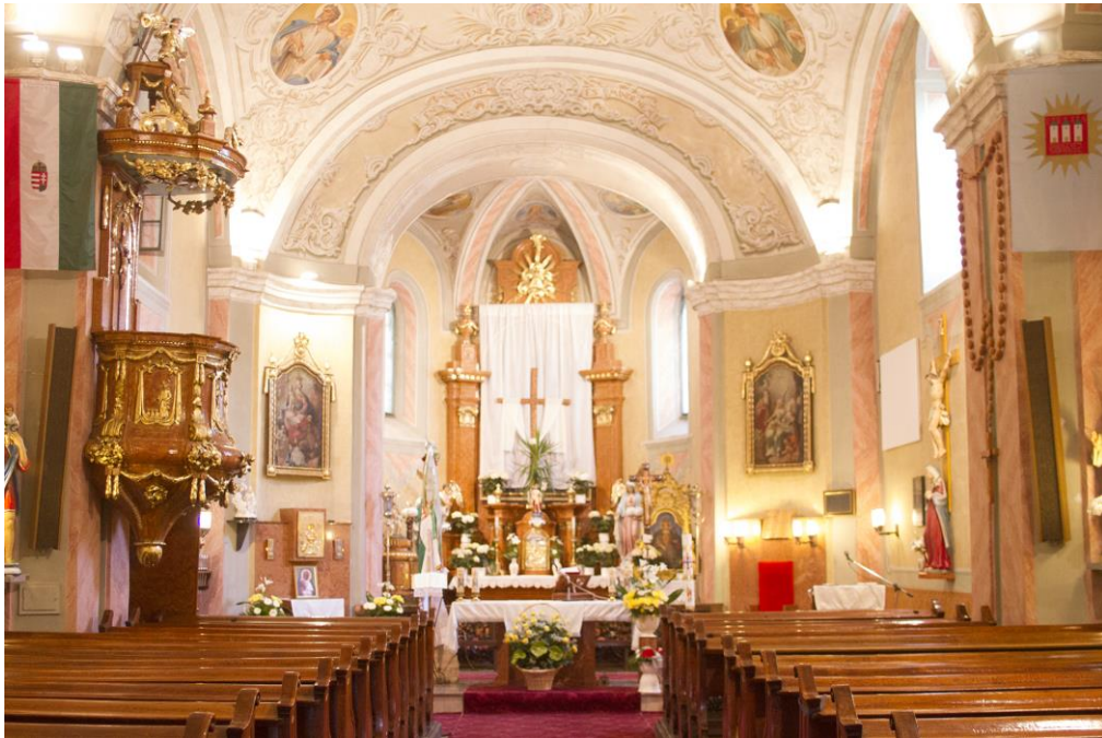
6. Templom belső a főoltárral és balt oldalt a szószékkel