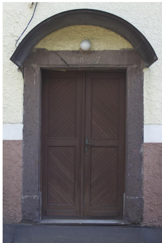
4. Templom oldalajtó az átépítés évszámával