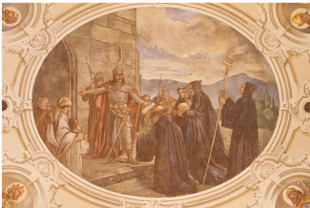
9. A mennyezeti freskó 1892-ben készült, amelyen Aba Sámuel király átadja a bencés szerzeteseknek az általa épített templomot.