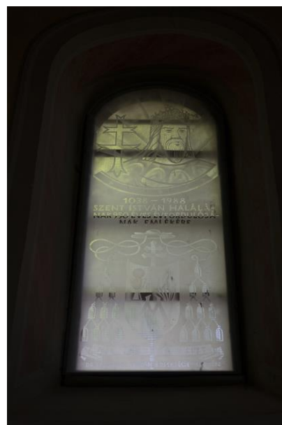
11. Templom ablaküvegei (balról-jobbra haladva: Szent László, Szent István, Szent Péter, IV. Károly és Szent István ábrázolásával)