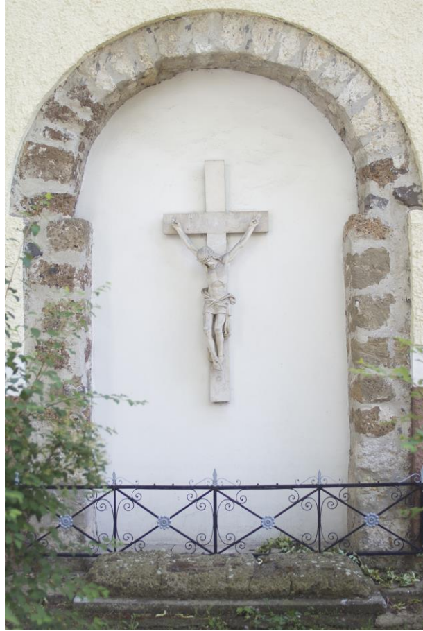
5. Árpád-kori templom bejárata volt a kibővítés előtt