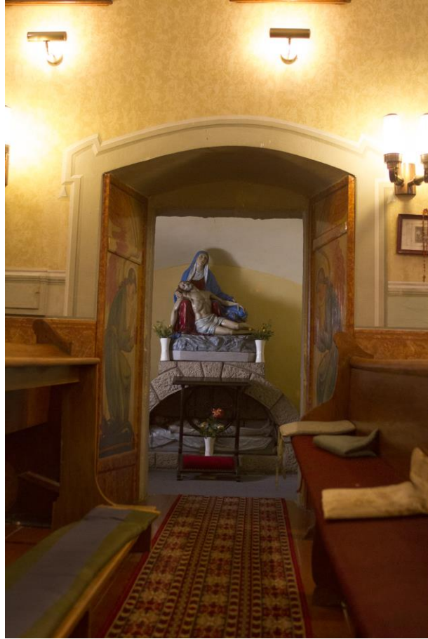
10. Fájdalmas Szűzanya Kápolna