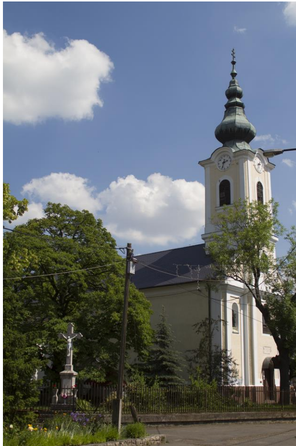
1. Szent Péter és Szent Pál Római Katolikus Templom, Abasár