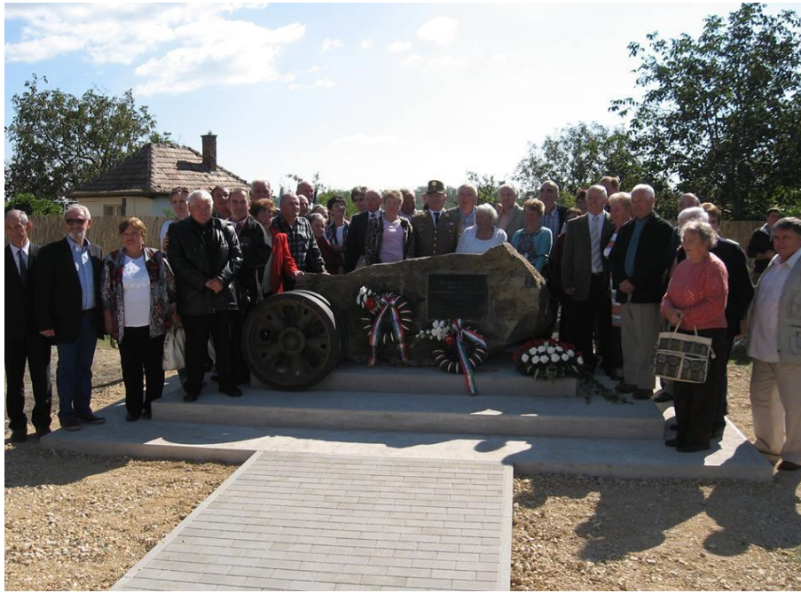
5. 44. harckocsi ezred emlékére készült emlékmű avatása (2014)