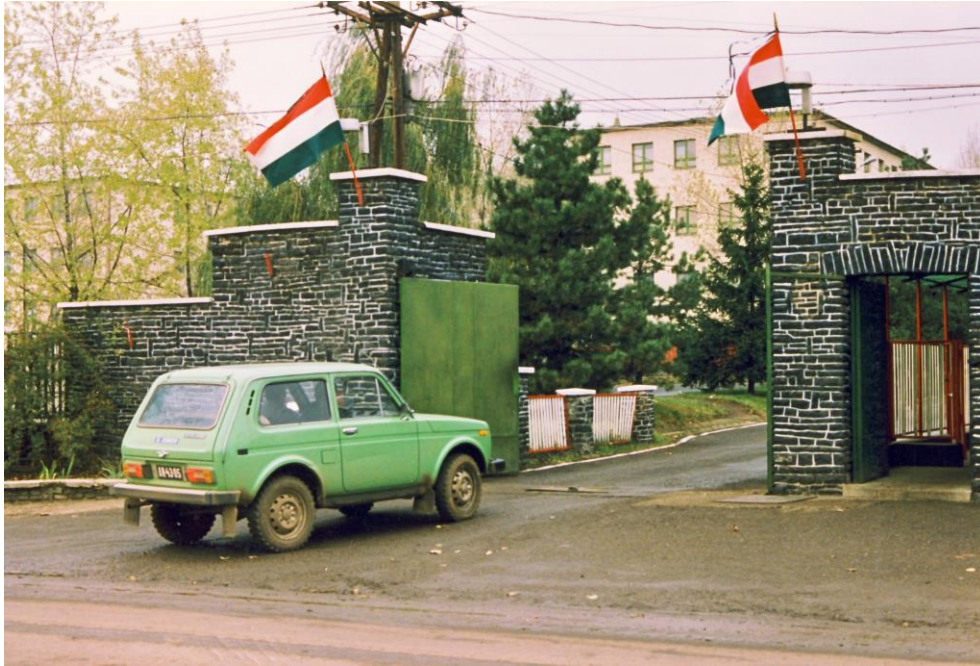
1. A laktanya főbejárata