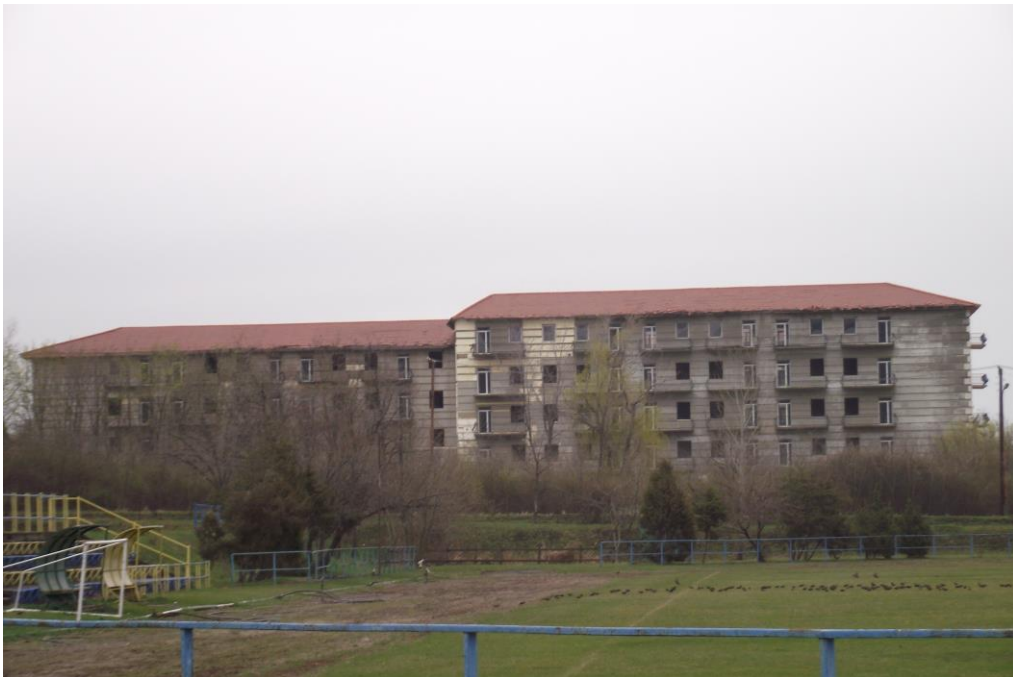
7. Jelenleg a Honvédségi laktanya látképei