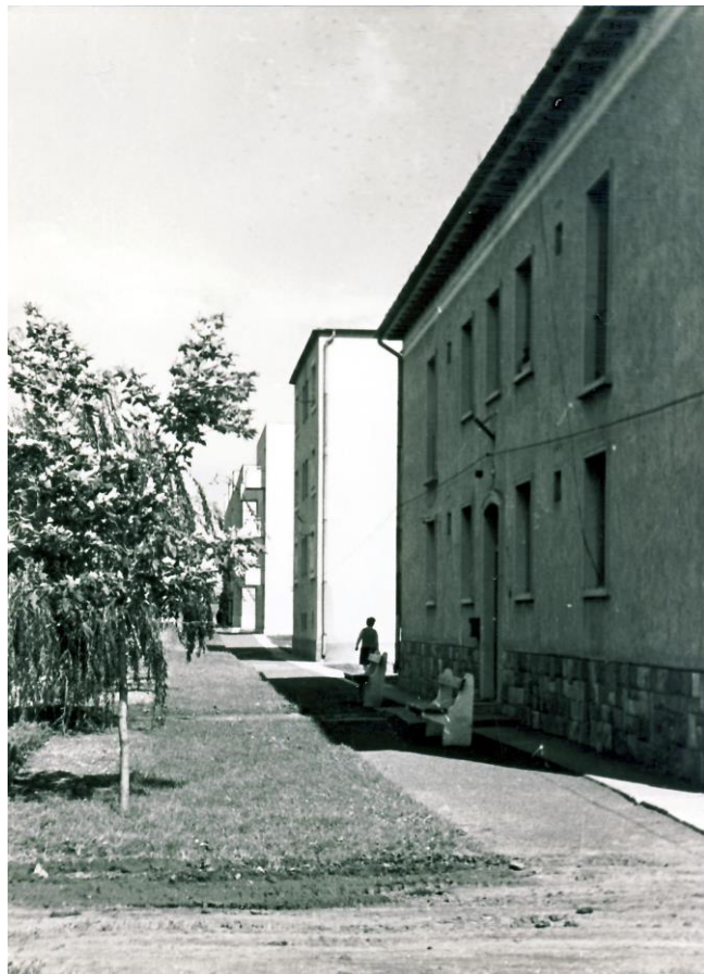
4. Abasári honvédségi lakótelep