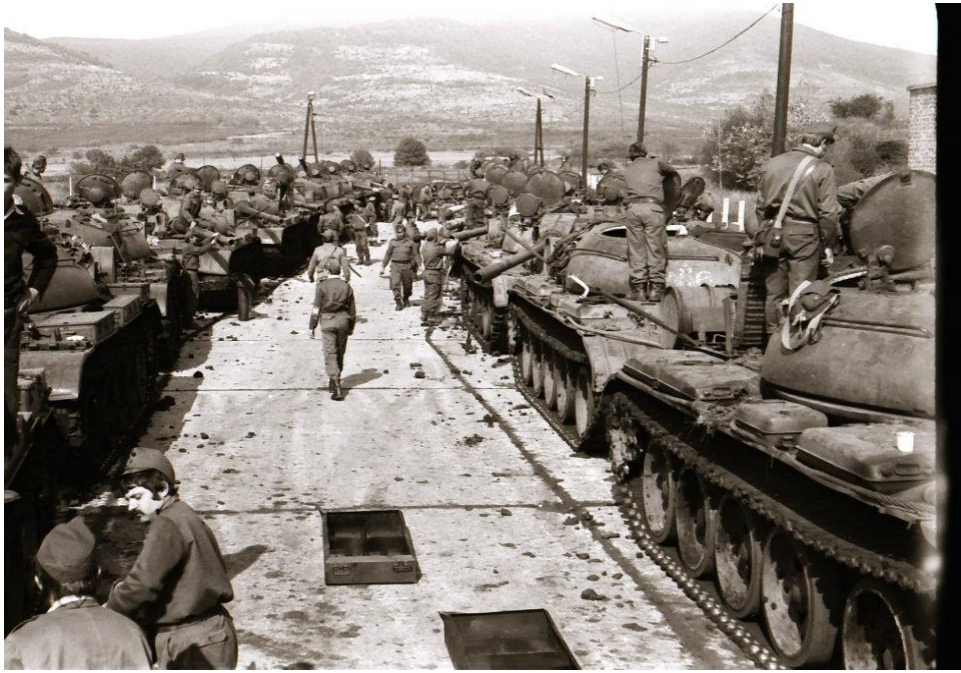
3. A 44. harckocsi ezred gyakorlata a Tatármezőn