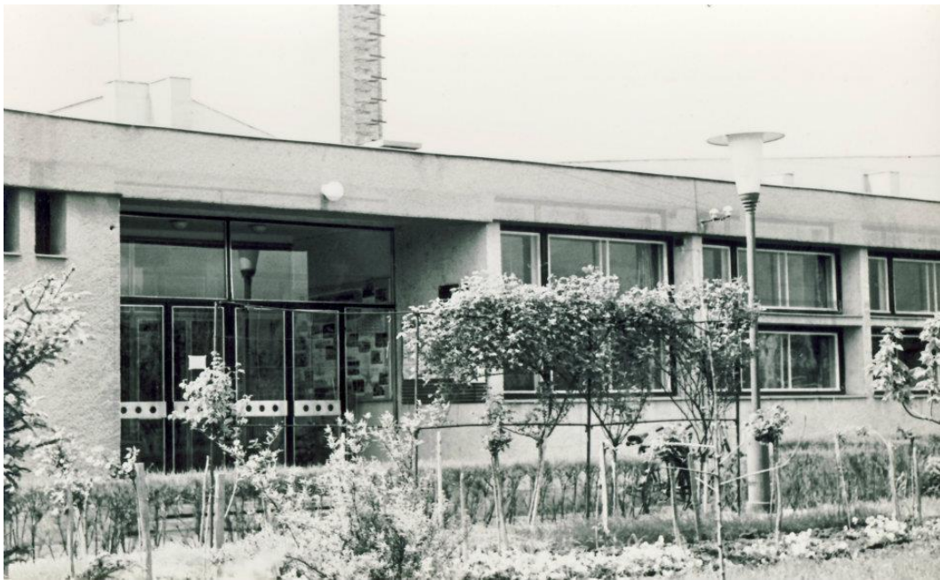
6. Egykori Tiszti klub külső felvétele