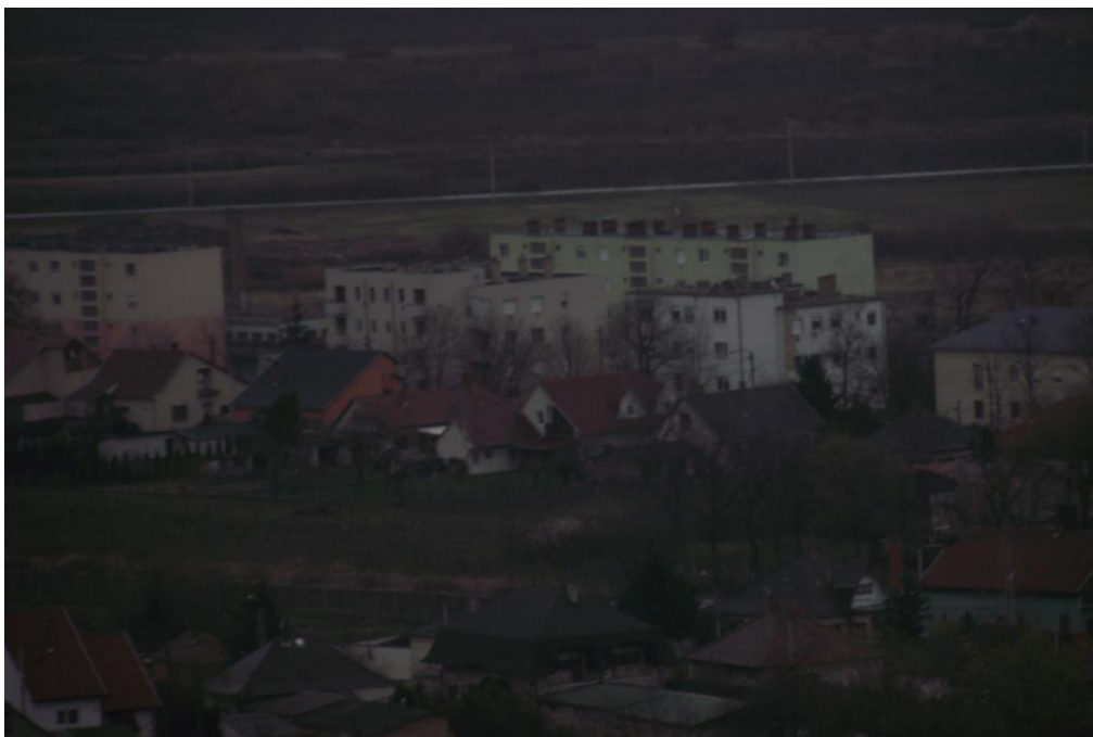
8. A Honvédségi lakótelep látképe madártávlatból napjainkban