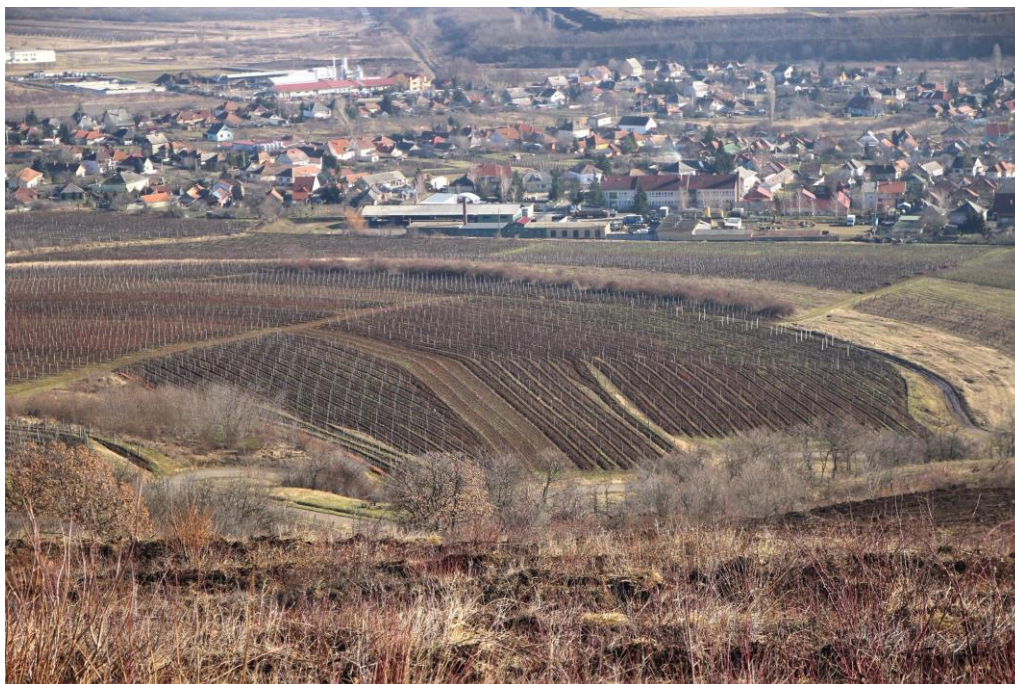
3. Sárhegy keleti oldal --- szőlőtelepítések (háttérben Abasár)