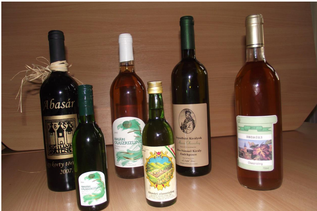
6. Felvétel a palackozott Abasári Olaszrizling borokról (1992-2012)

2. A Htv. 1. § (1) bekezdés j) pontjának való megfelelést valószínűsítő dokumentumok, támogató