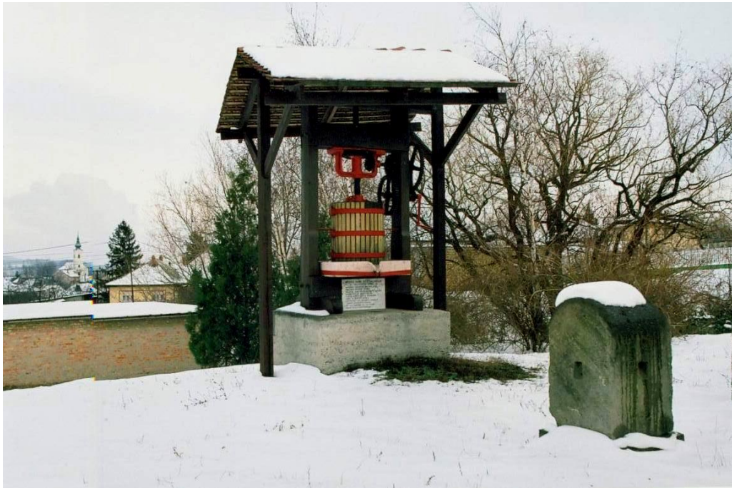
5. Emlékprés a Kővágói pincéknél