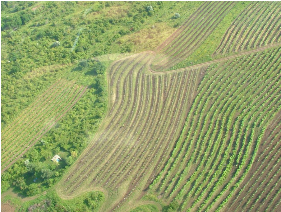
2. Sárhegy oldalában található teraszos szőlőültetvény