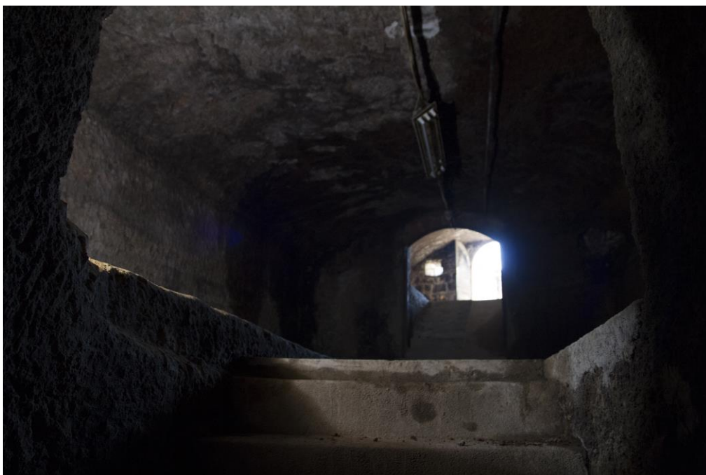
4. Részlet a pince bejáratról