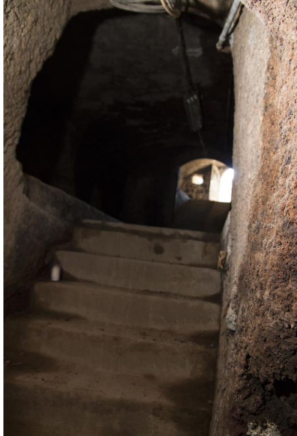
5. Részlet a pince bejáratról