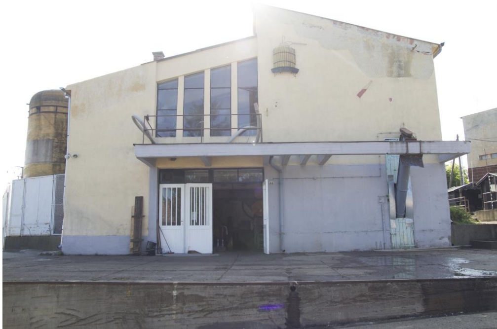
1. Abasári Rákóczi TSZ működése idején az emlékpince főbejárata régen és napjainkban