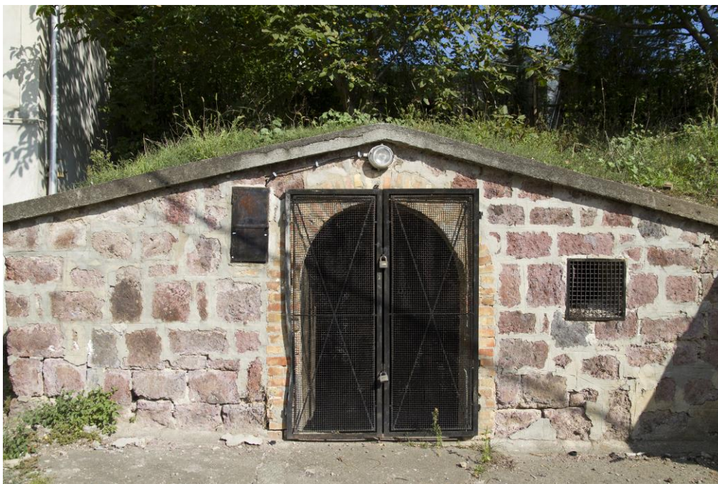
2. Emlékpince bejárata