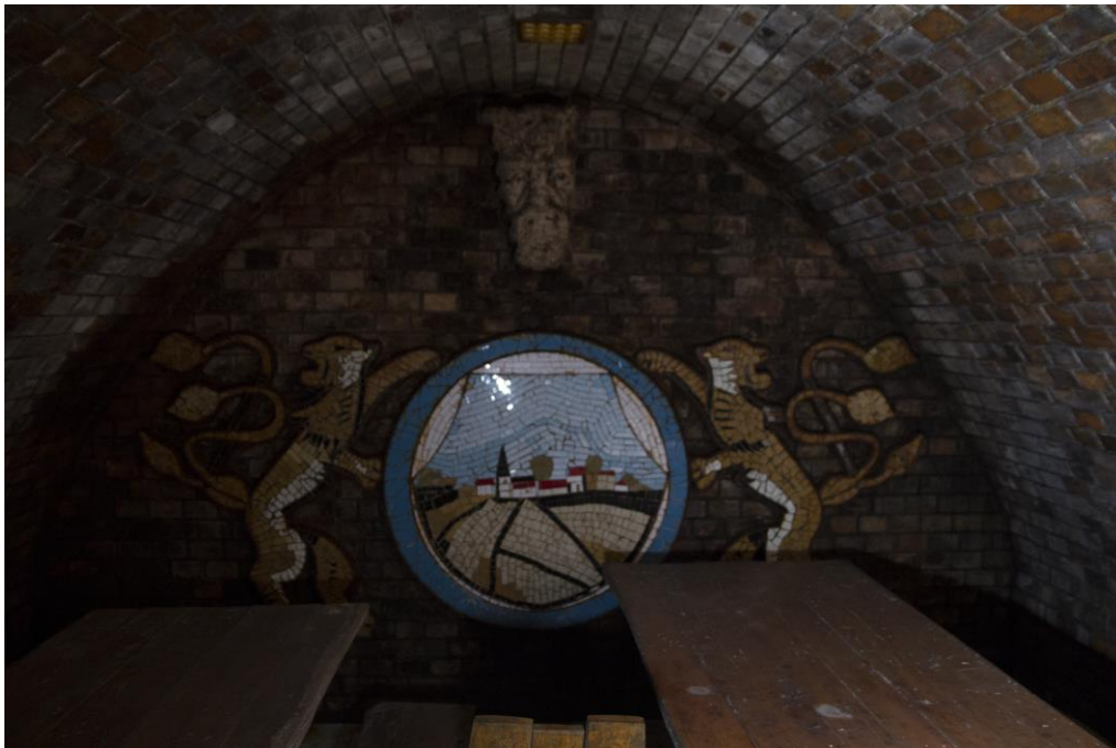
6. Az emlékpincében található vendég fogadó rész