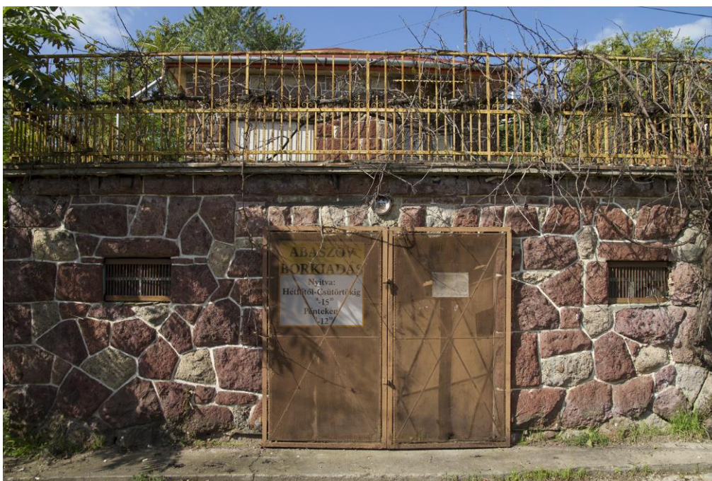
2. Emlékpince bejárata