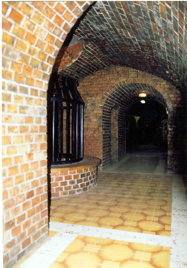
7. A pincében található kút, ami eredetileg a Sármonostor kútjaként működött