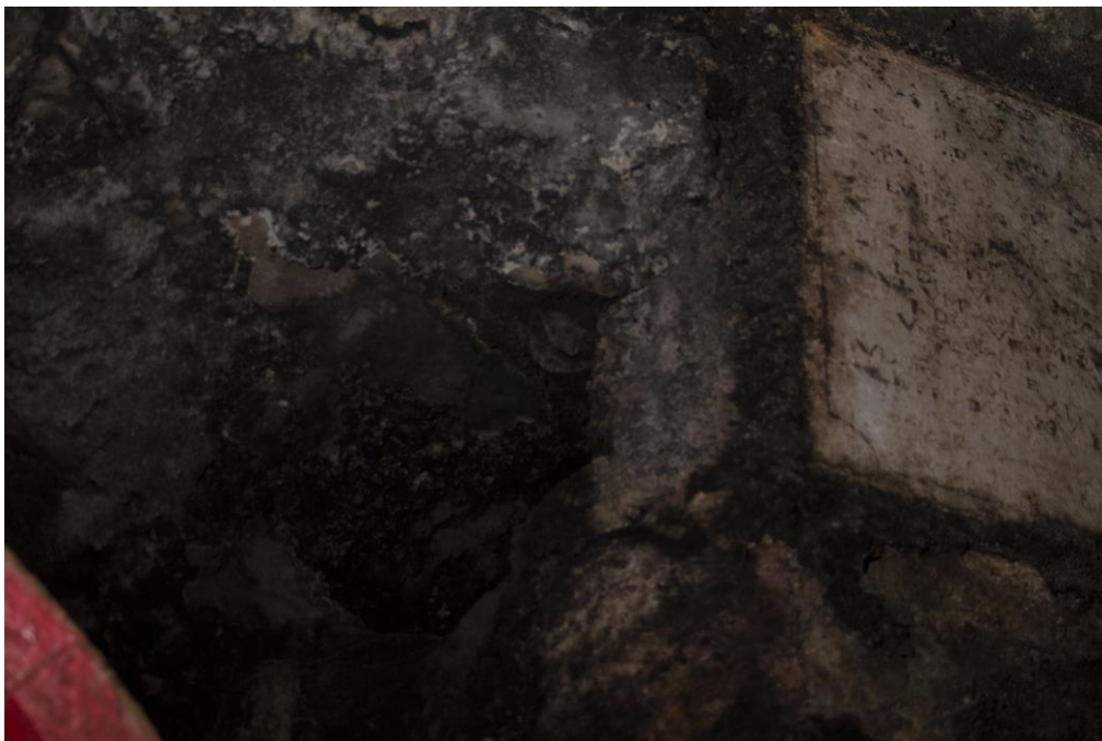
3. Vörös márványtábla chonogrammos felirattal (jobbra) és Aba Sámuel nyitott üres sírűrege (balra)